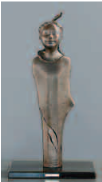
「花信」ブロンズ W20×D13×H37 (cm)