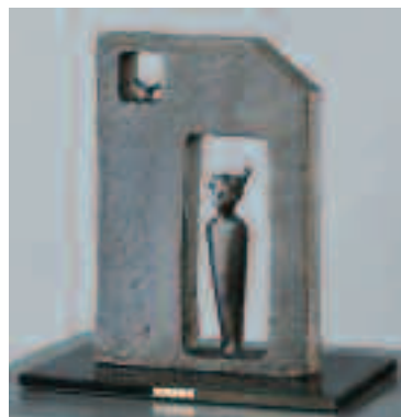
「風まで」ブロンズ W25×D14×H25 (cm)