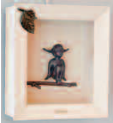
「囁りの木 2020- I」ブロンズ W24×D10×H27 (cm)