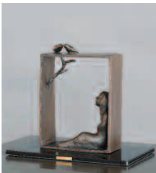
ブロンズ W25×D14×H18 (cm)